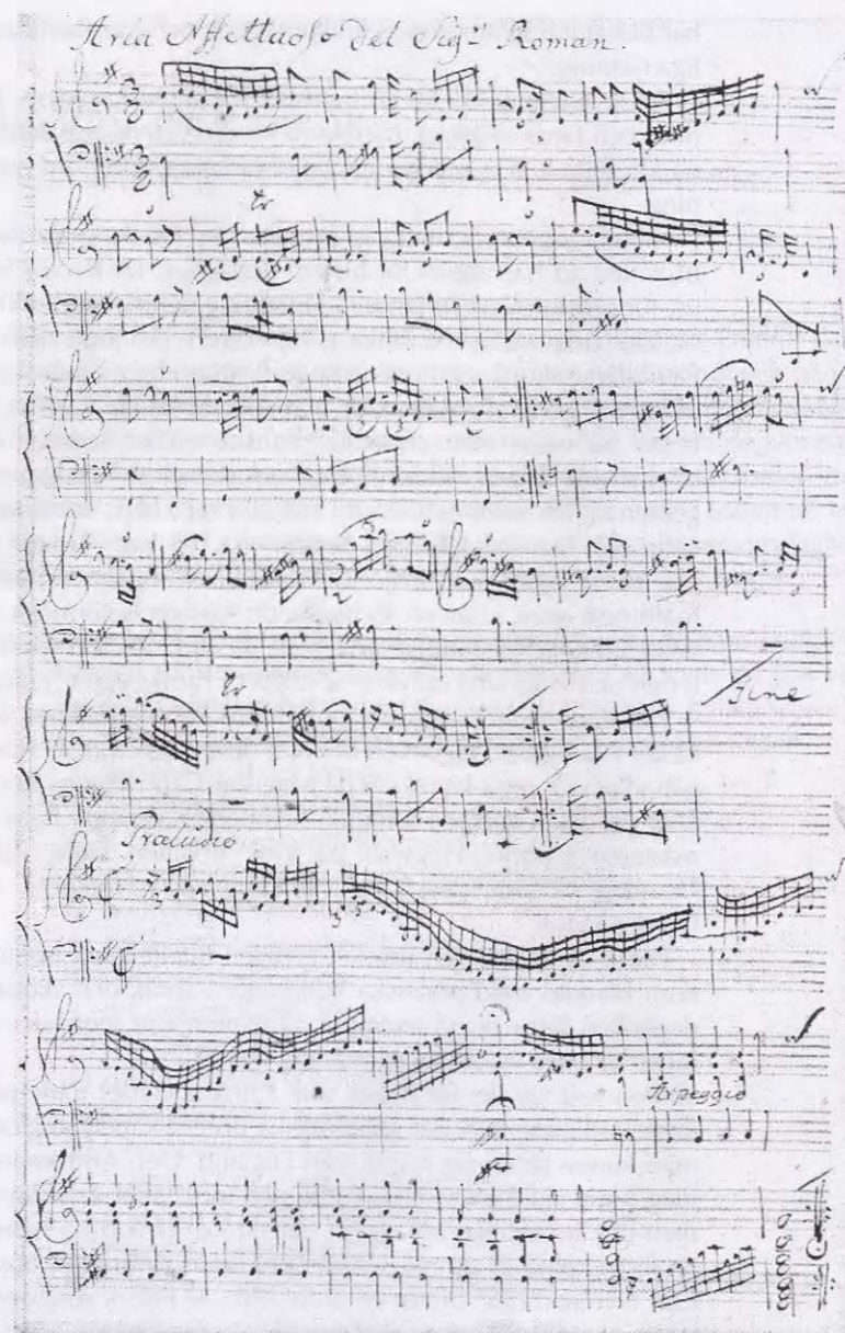
Notsida ur handskrift, daterad 1743 med aria tillskriven Johan Helmich Roman (1694–1758).