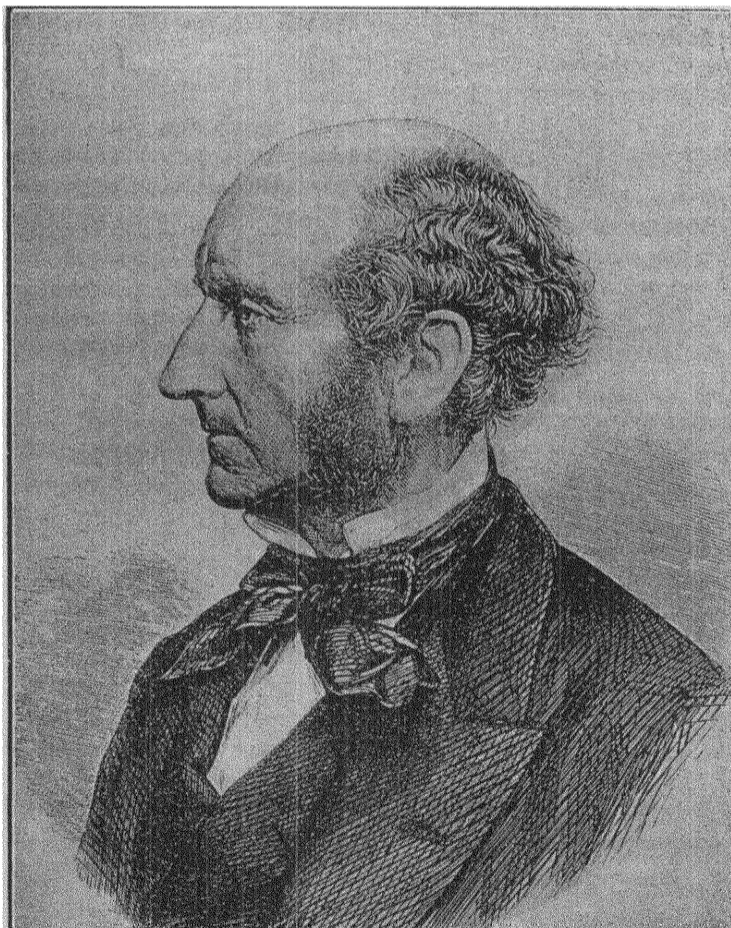
JOHN STUART MILL

År 1865 valdes han till ledamot af parlamentet, fast han uttryckligen nekade att personligen arbeta för sitt val eller att offra några pengar på det, och fast han startade med ett