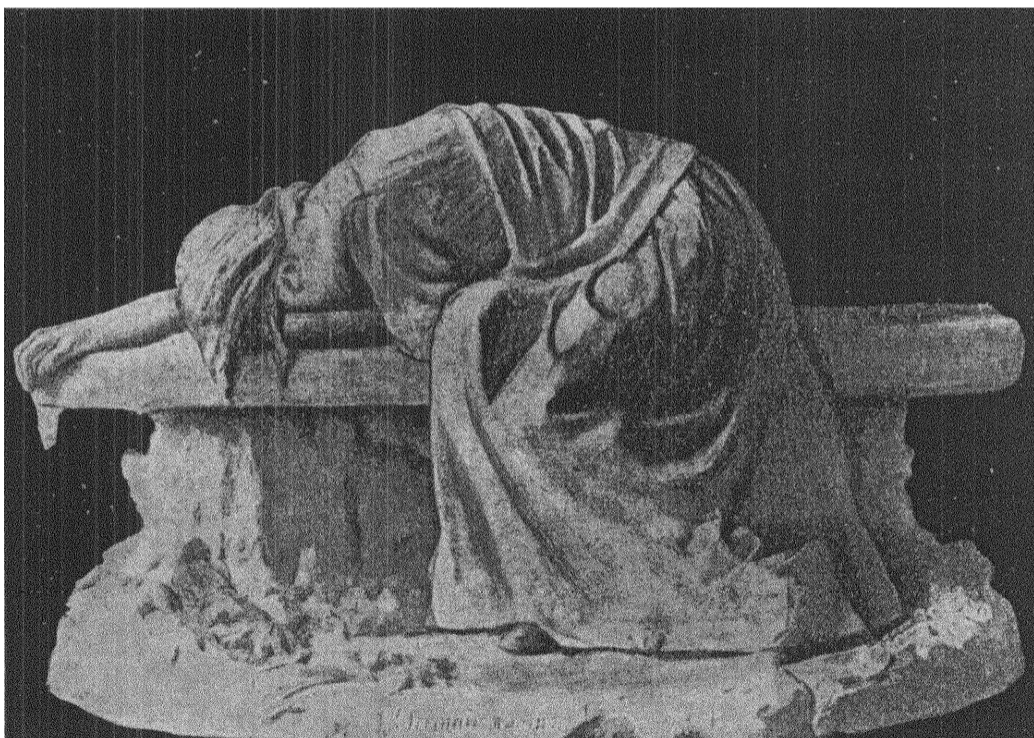
S. Marina: HÖSTLÖV.

Att i ett sådant viktigt ögonblick vara dömd till sysslolöshet det kännes nästan som ett slags förvisning just