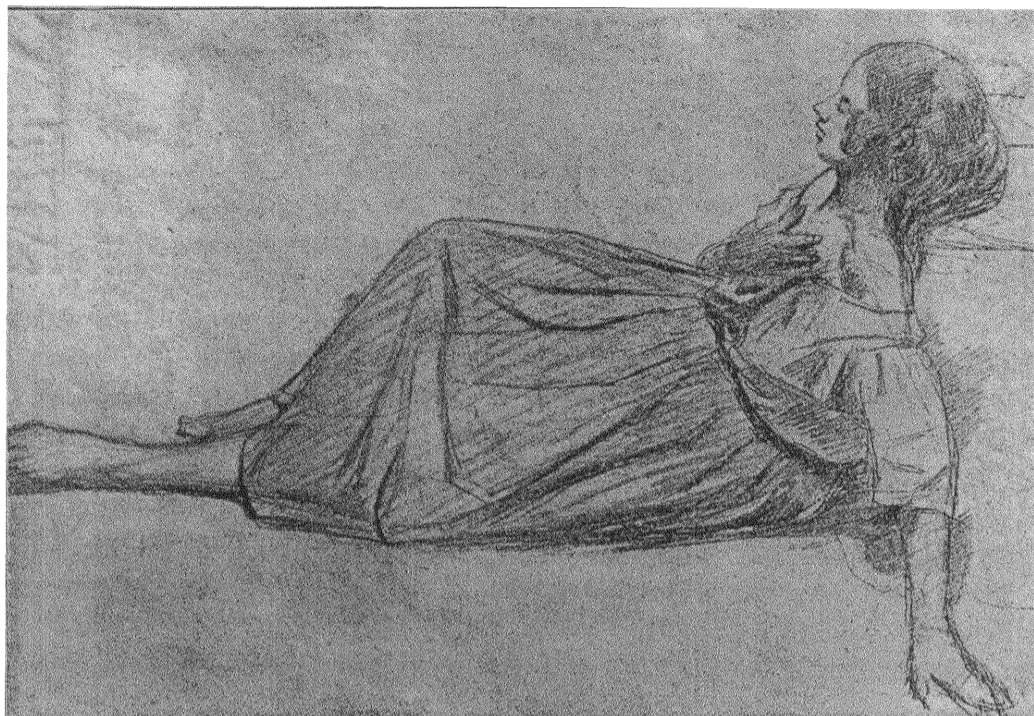
KVINNOSTUDIE av J. B. C. Corat. Pennteckning.

Icke blott partikamrater väntas emellertid till Stockholm utan även andra av radikal prägel. Ett sammanträffande av alla dessa, oberoende av partier, förberedes därför till ev. den 16—18 sept. genom för denna sak i arbete varande kommitterade, svenska kvinnor. Diskussionen kommer att upptaga aktuella kvinnospörsmål samt ev. den socialistiska fredskonferensens förhandlingar och beslut.