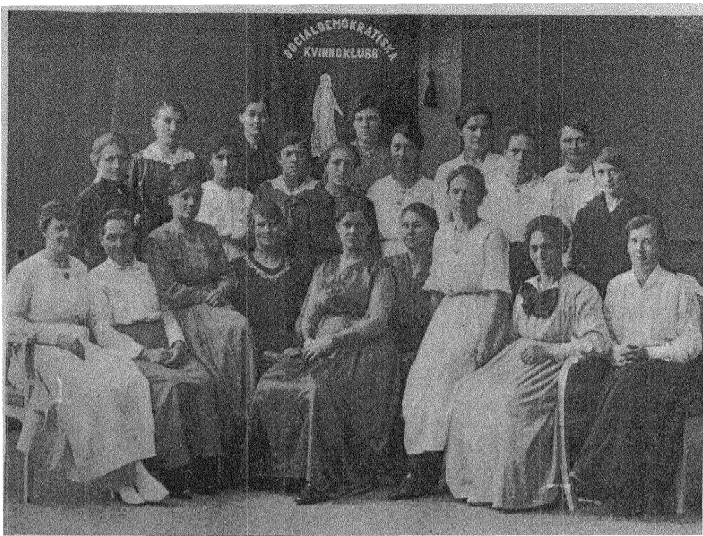
Lysekils socialdemokratiska kvinnoklubb.

Vi anse nämligen att kvinnornas förvärvsmöjligheter begränsas genom en