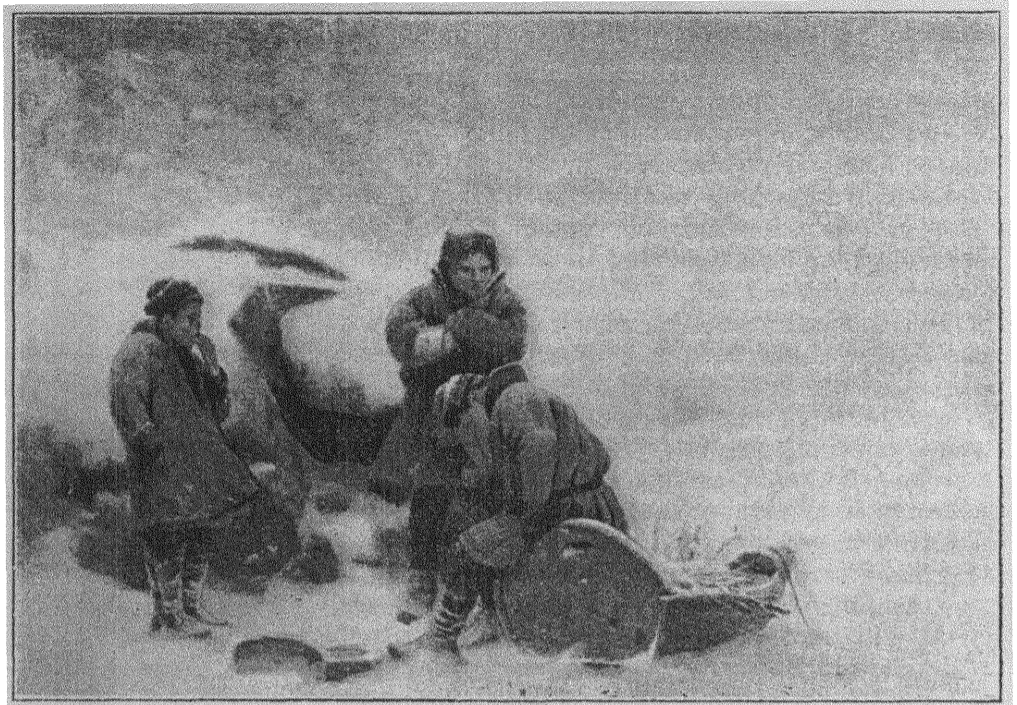
Tirén: DE VILSEGÅNGNA.