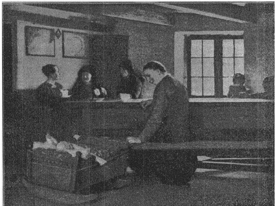
Salmson: HOS ARRENDATORSKAN.

Tanken om statspension för änkor är ej heller ny för kvinnorna här i landet. Socialdemokratiska kvinnoorganisationer ha länge beaktat frågan och nu senast på socialdemokratiska kvinnornas kongress 1914, där frågan behandlades i samband med de nya barnlagarna, togs den med i skrivelse till regeringen som ett särskilt önskemål. Även Landsföreningen för kvin-