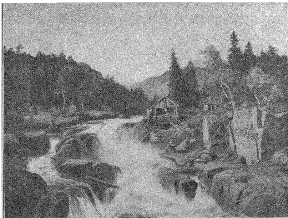
Edv. Bergh: Landskap med vattenfall.

Begär någon brott som här sägs vanemässigt eller för att därmed bereda vinning, dömes, om fostret kommer utan liv eller ofullgånget fram, till straffarbete från och med ett till och med sex år, och, i annat fall, till sådant arbete i högst ett år.