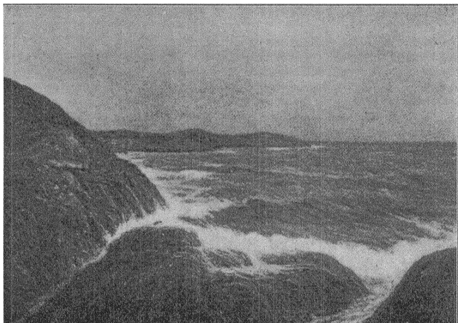
Karl Nordström: Dyrning.

hade hon i stället en alldeles hänförande utsikt över allt detta hon ansåg som centralast i Stockholm, just därför att det hörde tillsammans med alla hennes dyrbaraste minnen. Den breda, ljusa Katarinavägen skulle också bli hennes dagliga promenadplats; denna, i likhet med den präktiga Kungsgatan, bäge som livgivande pulsådror sprängda fram ur gamla stadsdelar, hörde till de trafikleder hon tyckte inte vandaliserade Stockholm. Det låg detta säregna, ljusa över dem, som kanske mest framträdde i vårtid och för henne blivit identiskt med allt äkta stockholmskt.