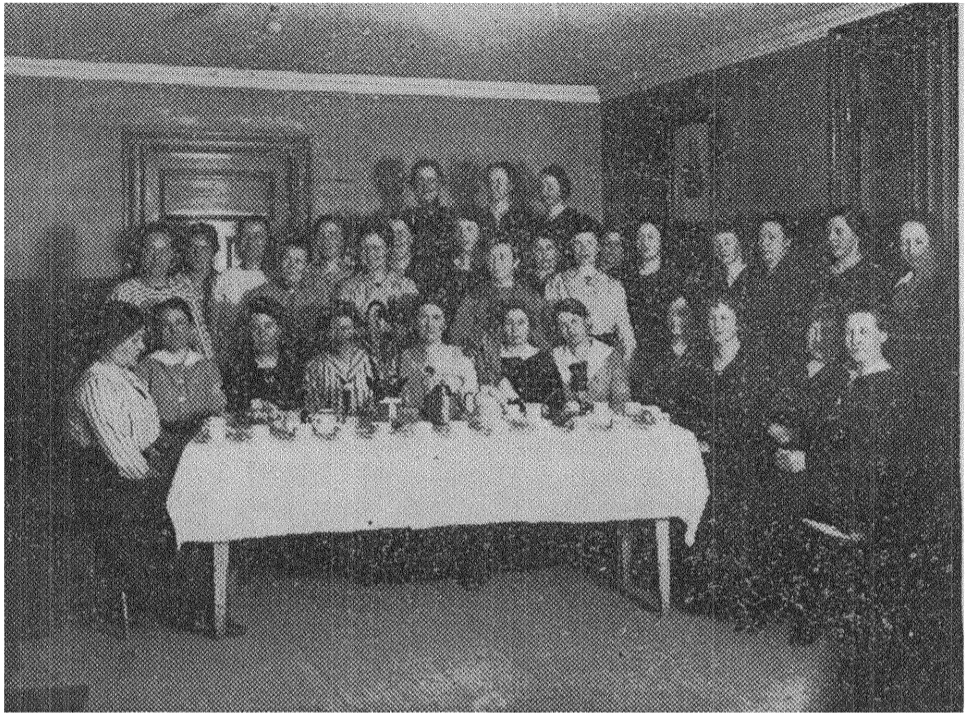
Bollnäs soc.-dem. kvinnoklubb.

Sedan gällde det det världsberömda Lessebo. Men här började äventyren att vilja ha ett ord med i laget och jag kom inte dit förrän på kvällen och de hade naturligtvis tagit mötet på e. m. En lördagseftermiddag vet man ju är omöjlig för de flesta arbetarehustrur och det var väl dem man skulle räkna med. Jag lämnade en del tryck- och förhållningsorder och lovade komma åter 2 maj.