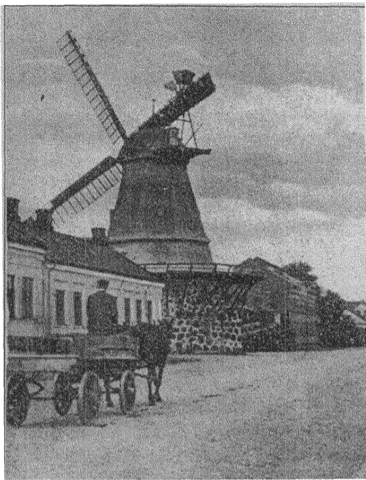
Kvarn i Eslöv.

blir det stor fest med detsamma. Vi ska inte spara på färger och glädje när det inte är nödvändigt.