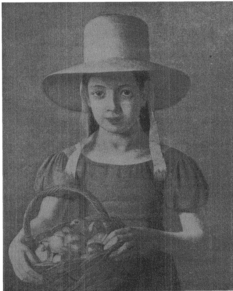
Målning från 1830-talet av Jörgen Roed.

strävanden att skydda hemmen och barnen. Men vi ha varit lojala och våra kvinnor arbetat med en energi och målmedvetenhet, som är all pris värd och med all säkerhet höjt upp valrörelsens arbete och fått, särskilt över de möten, som av dem arrangerats, något av festiviteten, som absolut haft stor betydelse för den kvinnliga väljarekåren. Om vi nu ett ögonblick kunna känna oss rätt nöjda, både med vad som presterades under valagitationen av våra organiserade kvinnor och det vi vunnit därmed, så är det icke någon orsak för oss att ett ögonblick förbliva "på stället vila". Nej, tvärtom. Vi ha sett vad vår kvinnorörelse nu betytt och alla års mödor att genom densamma sprida upplysning ute ibland skarorna. Det har betytt så mycket, att vi allt fastare fått klart för oss att våra organisationer äro alldeles nödvändiga för arbetarerörelsens och socialdemokratins frammarsch. Denna förvissning är en av de stora vinster vi vunnit genom detta val. Det är en glädjande visshet men en så oändligt ansvarsfull sådan. Kraven komma också med all säkerhet att växa och partiet och kvinnorörelsen komma att ställa ännu större fordringar på oss. Vi få inte stanna vid att vara goda arrangörer av mötena, organisatörer och agitatorer, vi måste