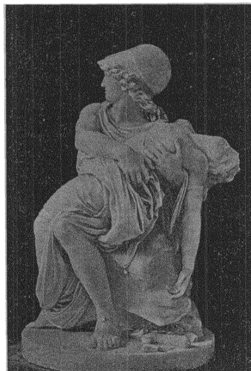
Sergel: MARS OCH VENUS.