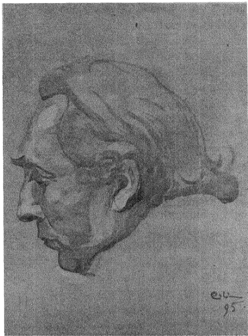
Porträttstudie av Carl Larsson.

Jämfört med måleriet har skulpturen fört ett tynande liv. Det var först med den man, vars namn vi läsa här ovan, som skulpturen blev stark nog att taga upp tävlan med systerkonsten måleriet. Johan Tobias Sergel föddes 1740, men redan under sextonhundratalet skapade måleriet genom inhemska mästare konstverk av än i dag bestående värde.