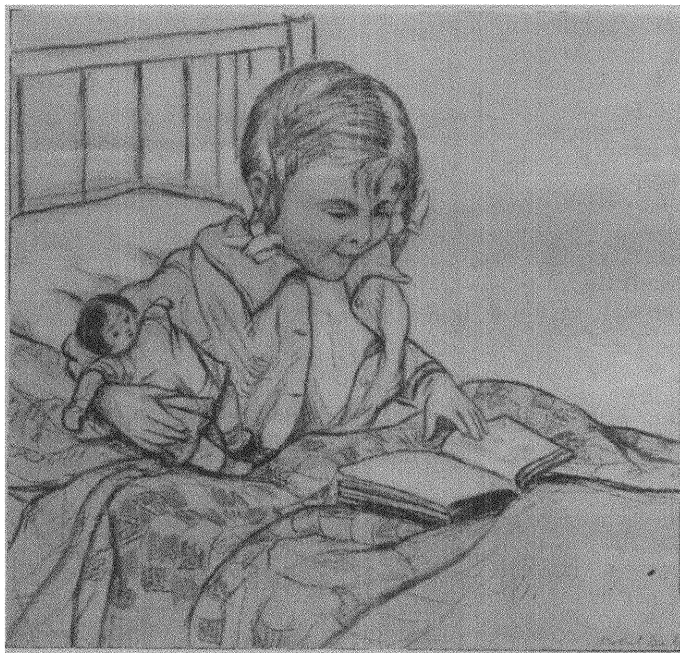
"Baby". Pennteckning av A. M. Burligh.

Ledning till skarpt iakttagelseförmåga, företagsamhet, medarbete, efterbildande, självskapande, d. v. s. lära sig arbeta. Praktisk kulturundervisning skall givas; är huvud och hand en gång hemma i tekniken och föremålen i hemorten, utvidgas lusten sedan gärna vidare till vidsträcktare områden, och till historisk fördjupning. De tidigare förhärskande andliga färdigheterna i räkning, geografi, historia jämte de oumbärliga i läsning och skrivning inriktas av sig själva hos barnet på det område där det av den inre böjelsen och intresset som kunskapssökande kommer att huvudsakligast användas. Ingen osund äregirighet väckes, med sina osköna följer av själviskhet, "streberskap", hänsynslöshet, girighet och bedrägeri; men ej heller följer något tvångs- och straffsystem för fel och likgiltighet då ömsesidig hjälp från kamrat till kamrat, från äldre och skickligare till nybörjarna genom nästan omärkbar påverkan av gemensamhetsledningen frambringar en anda där svårigheter må kunna, mycket lättare än nu, finna lösning. Icke blott de sociala dygderna hjälpsamhet, fördragsamhet, frivilligt underordnande, stark ansvarskänsla, den enskildes ansvar för det hela och det helas ansvar för den enskilde, utvecklas och övas, utan de unga vinna också insikt i de allmänna samhälleliga huvudsaksmå-