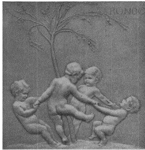
"Ronda". Relief av S. Schwartz.

Den goda "Kinderstugan" behöver ej längre bli ett privilegium för de bättre ställda. I lek och lättaste arbete blir det outtröttliga verksamhetsbegäret hos barnet väckt, lett och vant till uthållighet. Dess skaparvilja att forma det bildbara stoffet, dess vetgirighet, och dess medkänsla med djur- och växtlivet blir utvecklat. Således växer barnet omärkligt in i den egentliga skolan. Ingen smärtsam och ångestfull övergång behöves då förekomma från friheten till tvånget, från leken till undervisningen, från det sorglösa, obundna till lydnad och stillasittande. Det