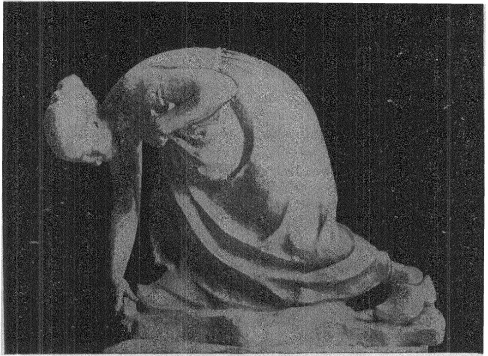
Herm. Neujd: POTATISPLOCKERSKAN.

Hur skedde nu detta? Tillämpades principen: "Rädda modern åt barnet?"