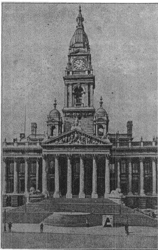
Stadshuset i Portsmouth.

Bostadsfrågan är även mycket brännande i England liksom i Sverige.