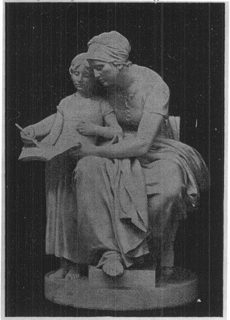
Delaplaneli: MODERLIG UNDERVISNING.