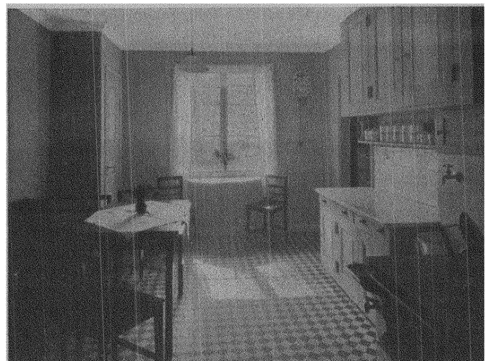
Kök till 1- och 2-rumslägenheter.