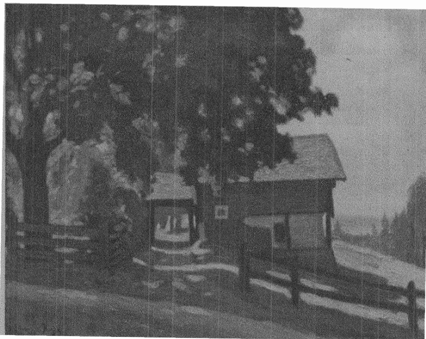
Louis Bourgeois: GÅRD VID SILJAN.

— Vad du är tokig, sade hon sedan jag äntligen tystnat. Låt oss för guds skull behålla högfärden. Det är ju det enda som väsentligt skiljer oss från djuren! L. Ö.