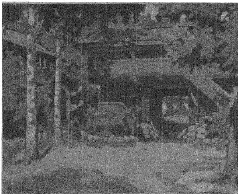
Louis Bourgeois: GÅRD FRÅN SILJAN.

Nu hade de nått kulltoppens krön. Och där måste de stanna. Söderns eldiga barn voro de mer mottagliga för skönhet än de som tagit vidderna i varaktig besittning.