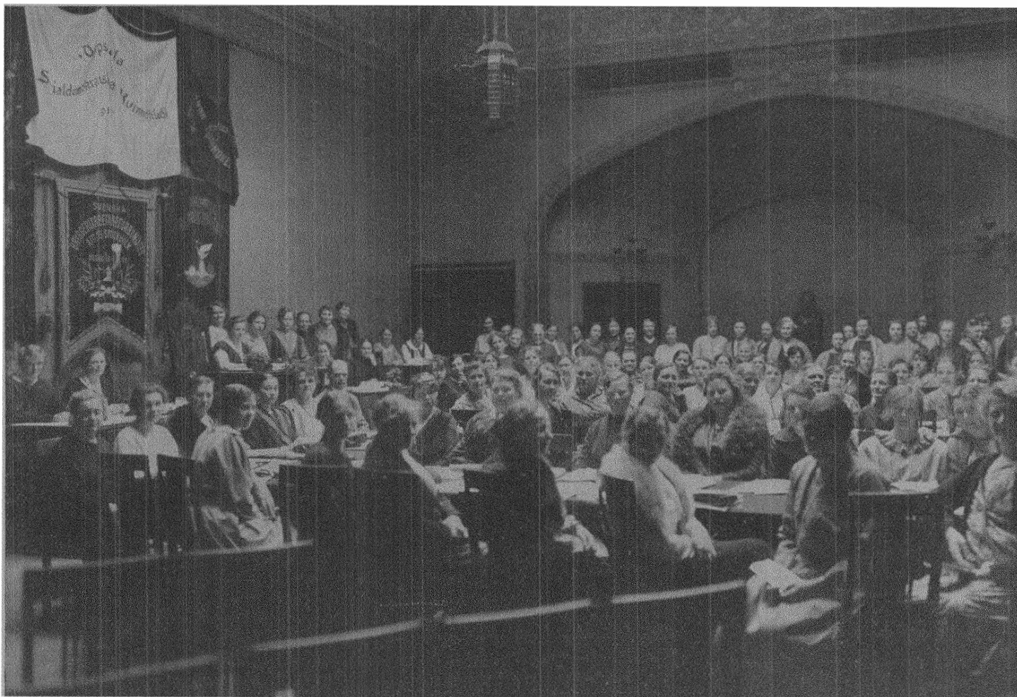
Kongressen i arbete.

en resumé över händelserna inom arbetarörelsen i Finland under de sista åren.