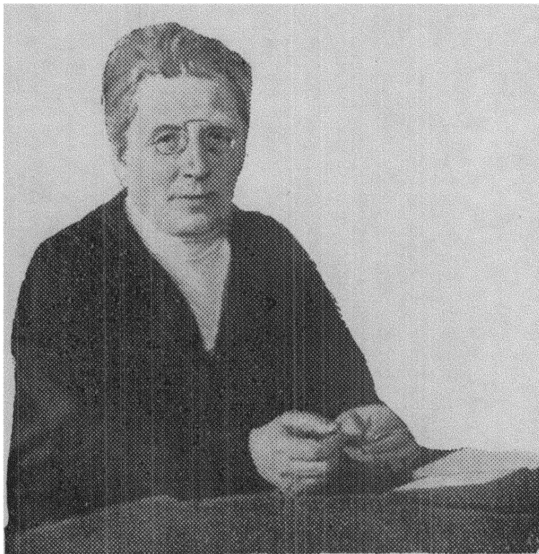
Kultusministern fru Nina Bang.

En strålände majdag, när solen kommit sundet att glittra i blåaste blått, när de späda löven i Köpenhamns parker sila ljuset genom sitt ljusst gröna bladverk över markens doftande vårblomster, kommer under tecknad, i sällskap med Arbetets kvinnliga medarbetare, till Kongens By, för att, om lyckan är god, få ett samtal med Danmarks och Nordens första kvinnliga minister, kultusministern i ministären Stauning, fru Nina Bang.