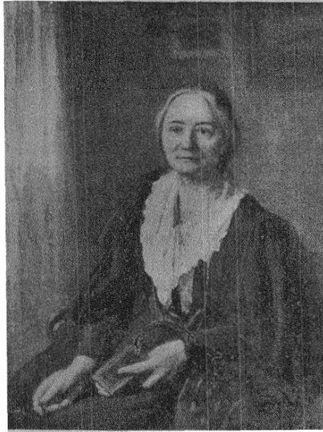
Hanna Pauli: ELLEN KEY.

skilda utvecklings- och intressefacerna i Ellen Keys många områden överspännande intressen och verksamhet. Efter redogörelse för hennes andligt anrika förfäder och föräldrar får man göra bekantskap med Ellen Keys lyckliga barn- och första ungdomstid på det vackra herregodset Sundsholm, i det natursköna Tjust i Småland. Här insöp det rikt utrustade barnet redan tidigt, alltmer medvetet, den skönhetsmättade syn, som senare skulle bära så rika frukter i hennes estetiska skönhetsförkunnelse.