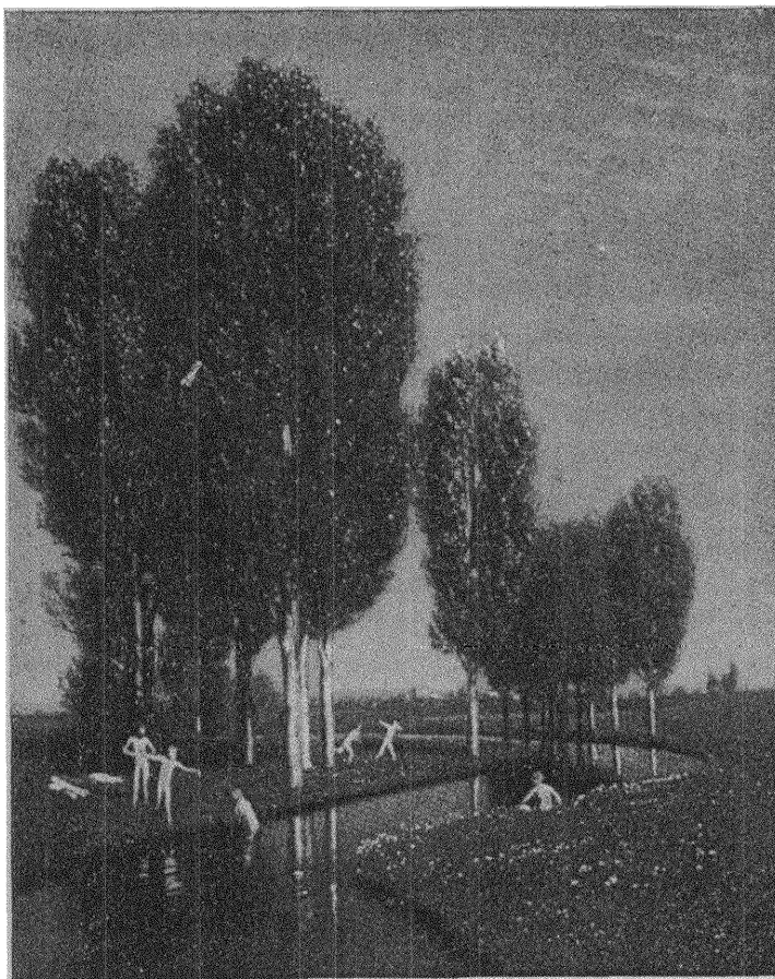
Böcklin: LYCKLIGA MÄNNISKOR.

Trasymakus. Men lastad med ogärningar är jag.