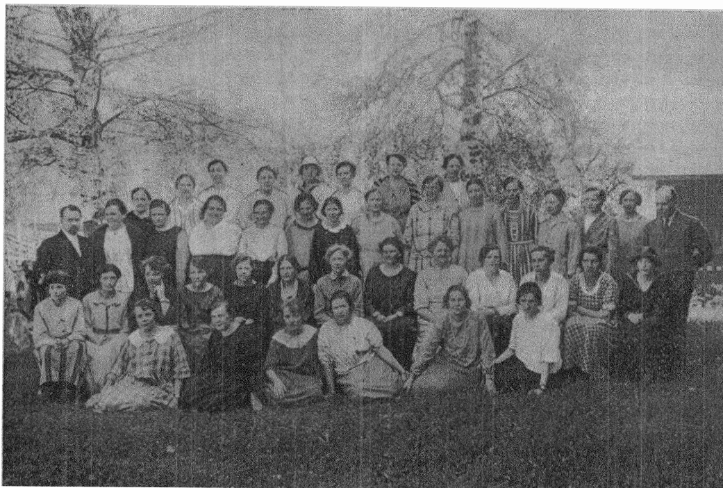
Deltagare i den första kursen för kvinnor i Brunnsvik.