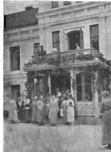
FRÅN CENTRALSTYRELSEMÖTET PÅ FOGELSTAD. GÄSTERNA VÄLKOMNAS.