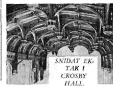
SNIDAD EK-TAK I CROSBY HALL.

skall då äntligen på lika plan leda till mänsklighetens sanna bestämmelse och största möjliga utveckling. — En radikal, omstörtande och häpnadsväckande bok! En milsten på vägen till köns- och därmed också världskännedom. Att denna väg, som vi i början av denna artikel betonade, redan uppträttas och beträffas av många kvinnor, bevisas av talrika skrifter på detta område. Den nya ungdomens livs- och kärlekskänsla återspeglas särdeles klart och karaktäristiskt i Elses Strohs »Själöfverkligande» (Engen Diederichs förlag, Jena). Just i dess blandning av poesi och tanke, som varken är konst eller vetenskap och säkert icke grillas av alla, men just därför rik på uppslag och fångslande.