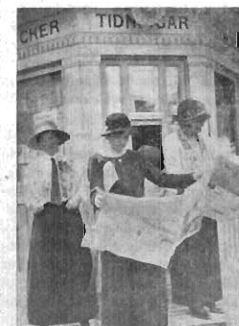
PRESSKOMMITTÉN LASER TIDEVARVET.