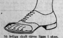
Så legda skall tårna ligga i skon.