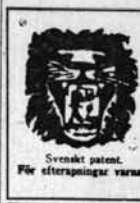
Sveakt patent. För eftertagning varnas.