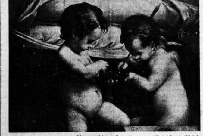
Efter en målning av Correggio.

Då postverket icke befordrar det nya årets tidningsförändringar före nyår, kända årets Tidevarvet No 1 i ej utskänd i förva veckan. Redaktionen bör därför fannst bäst att i denna bok sammanställa nr 1 och 2 till ett dubbelnummer.