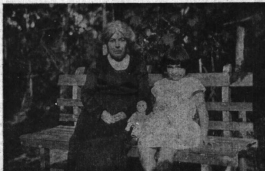
Al Tidevarvet Grazia Deledda Rom 6. 11. 1924

Det enda man skulle vilja anmärka på, är att Annalena Bilsini slutar en smula brådstörtat. Inledningskapitlet med sin praktfulla skildring av hur familjen drar med sitt gods till sitt nya hem är som en måttig ingångsnytt till ett väldigt epös och samma lugn och samma stora linjer utmärker också de två första tredjedelarna av romanen. Men sedan skyndar föråt. Påfylligt på och för något väl hastigt till slut de olika handlingar hon i det föregående låtit upprinna. Det är synd, framförallt därför, att det aldrig varit hennes egen mening att låsarna skola med denna enda volym skiljas för alltid från familjen Bilsini. Hon har vidare tänkt den fortsatta med åtminstone två andra, kanske t. o. m. tre, men hon har under arbetets gång ansett det klokt, att låta var volym bildas ett avslutat och oberoende helt, en metod som är modern och kanske innebär vissa praktiska fördelar, men vilken det ur konstnärlig synpunkt hade varit bättre att här ej ha gjort bruk av.