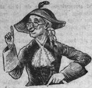
Helen Zenna Smith