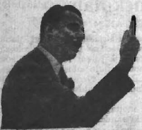
Sir Oswald Mosley talar.

Men om det tillfälliga läget är intressant kan det ändå inte måta sig med frågan, hur skall det i verkligheten gå med dessa miljoner ur utan arbete? Veckotanten.