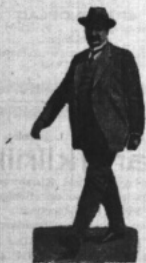
En glad regeringsbildare.