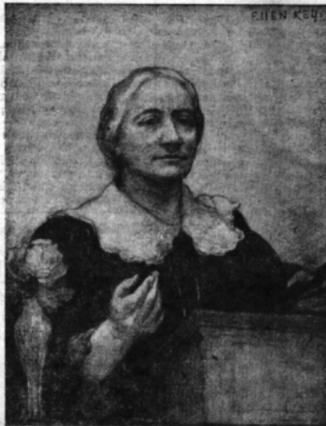
ELLEN KEY föreläser på Arbetarinstitutet Efter en målning av Hans Pauli

Det var Ellen Keys mening att skriva sina memoarer. Så vitt jag minns hade hon redan lovat dem åt Idun.