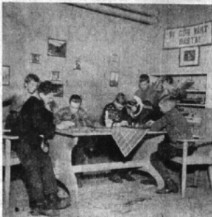
eller så, utan de få själva bestämma, hur de vilja ordna det för sig.