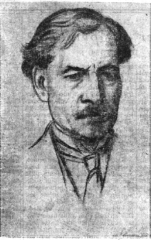
Ramsay Mac Donald 1928

Små notiser i tidningarna ha här meddelat att Mac Donald trätt ut ur Oberoende Arbetarpartiet, Independent Labour Party, sedan 37 år vanligen betecknad med de tre bokstäverna I. L. P. Detta utgör som bekant en grupp inom den stora sammanslutning av olika färgade socialistiskt riktade grupper som bär namnet Labour Party. Dess ledare är sedan 8 år tillbaka och all fortfarande Mac Donald.