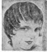
Permanent 15 kr.