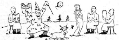
Fångarna troltkonster på Brocken —