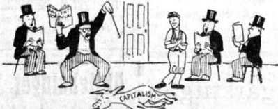
och i Lausanne.