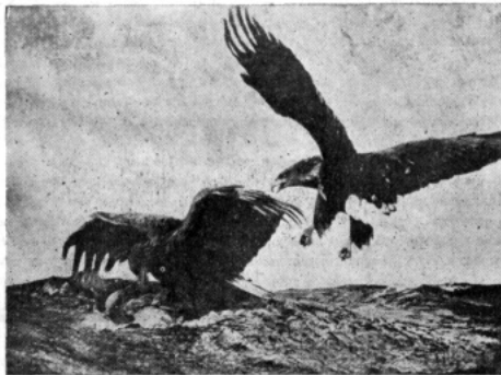
Havsörnar. Efter en tavla av Bruno Liljefors.

Så långt vårt vetande når tillbaka, finna vi, att stridsyxan av stammarna Homo och Accipitres grävdes fram första gången på salig Aeschylus tid. Denne vittne man blev själv det första ofvret, och själva hans dödsödet hade också karakteren av den kastade yxan. Mördaren var den gången Gypaetus, en gamörn, som behagade förvalda den lärde manns