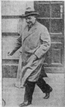
Äter en glad regeringsbildare!

PER ALBIN HANSSON har fått kongens uppdrag att bilda den nya regeringen. Vi ha åter — se bilden — anledning konstatera en kommande regeringschefes glada gång till sitt värv. De större borgerliga partierna underhandlingar om en ev. borgerlig samlingsministär ledde inte till något resultat, sedan hr Olsson i Kullenbergstorp, det nu så maktigtvordna bondeförbundets ledare, avböjt initiativet till en sådan.