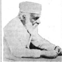
Valabhai Patel, före presidenten i Allindiska Nationalkongressen.