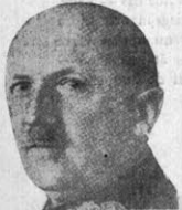
Rikskansler v. Schleicher.

TYSKA RIKSDAGEN öppnades den 6 december, dock icke utan störande intermezzo. Nationalsocialisterna hade i tid ordnat med ålderspresidentfrågan genom att invälja till riksdagen den 82-åriga generalen Litzmann, sålunda sex år äldre än Clara Zetkin. Generalen aktade dock inte för rovt att räkta ett ganska kraftigt angrepp mot rikspresidenten Hindenburg, som prisgav tyska folket åt bolsjevismen, ehuru råddaren — d. v. s. Hitler — stod redo. Därpå uppstod ett livligt slagsmål med 40 sårade.