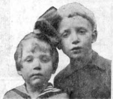
Vilken framtid ämnar vi skapa åt dem?