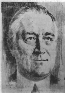
President Franklin Roosevelt.

SNABBARE OCH SNABBARE AV- LÖSA VÄRLDSHÄNDELSENA var- andra, avtecknande sig skarpt mot ett försvinnande fisdskedes afthonnimmel. Fredagen den 24 februari uttalade Natio- nernas förbund efter ett och halvt års behandling sitt slutomdöme om de japan- ska traktatbrotten. Japan protesterade och — som det väl utnyttjat tiden i rust- ningshänseende — kastade det på allvar sina trupper mot Jehol, intog provinsen, passerade kinesiska muren och står nu strax framför Peking. Men samtidigt skaka några av de större japanska fäznan av en våldsam jordbävning, som kostat 3,000 människoliv.