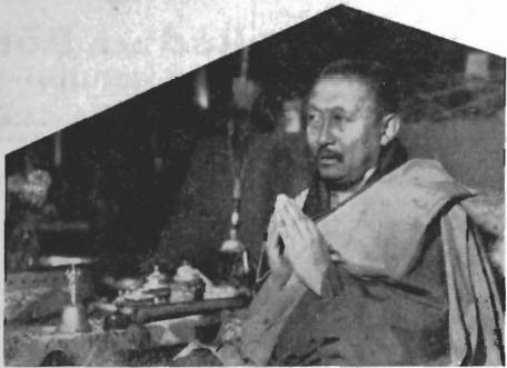
Den bedjande Panchen Lama.