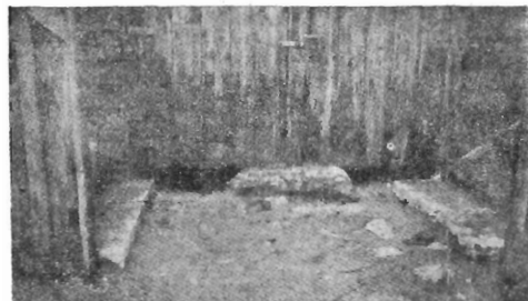
Fran Götteborgs nödbostäder. gardsinterior. (Ur Hyresvästern.)