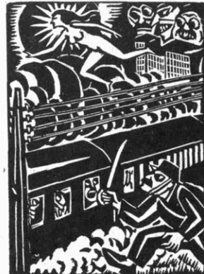
Idén på väg. Ur Frans Masereel: Die Idee.

Det är lätt att uppsätta anklagelseakten mot den parlamentariska demokratin, sade han. Partiväsendets avsigdoro äro iögonfallande. Små intressen och rädd omfallehet för de minst ödmödesgillas fördomsfullhet gör sig breda inom parlamentarismen. Men ingen är mera angelägen att låta demokratis utväxter ställas under betygsning än den som håller denna livsform för omistlig. Fasthållandet vid folkvåldet och dess frihet bottnar i den oryggliga förvisningen att ingen annan väg finns att gå. Friheten innesluter icke blott möjligheten till misbruk. Den innesluter också botemedlen däremot.