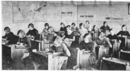
Barnen lägger orden i ordklasser före spelets början.

Om ett arbetssätt sådant som det ovan skisserade, som består av lärarens muntliga framställning (givetvis kompletterad av läro- och läseböcker), skådespel och arbetsövningar, ej åtföljes av läxor med