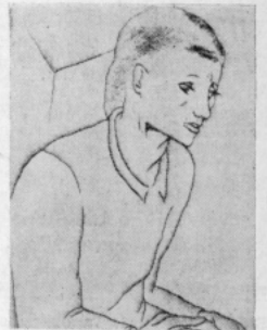
Såiftande öden. Efter en teckning av Mariette Lydis.

Man måste komma ihåg allt detta och man skall veta att det tillhör den nationalsocialistiska kvinnans väsen att inte opponera emot någon rähel från männens sida, och vore den än så svår, men samtidigt vara alltför mjuk, fin och kvinnligt för att kunna dela det så kallade manliga arbetet i politik, näringsliv, i vetenskap, sjukhus, kontor, affärer och laboratorier. Om man inte vill förtviva helt och hållet