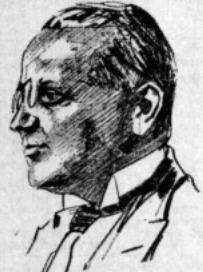
Aktuell statsman: Sovjets utrikesminister, Litvinov.

FURU ILSE SEGER , som — sedan hennes man lyckats ta sig ut från ett tyskt koncentrationsläger — sattes in i stället, har nu tack vare engelskt ingripande blivit lössläppt igen.