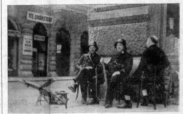
Vid 12-tiden på onsdagsmorgnaden gick vi till lägen på Sotensrogasse härifrån där vi stannade i några minuter, då man plöbjert blev varse att något hänt. I sådana märks det genast. Alla butiksinnehavare kommer ut ur sina bodar, synliga huvuden hänger ut genom fönstren och folk stannar på gatan och tittar till ett beständigt håll. Vi gjorde så småningom såg vi ur porten en "Deutsche Turnhalle" för att stora buskar ryckte ut följande med polis och militär. Man väntade ett ögonblick till så lösa på något hänt, men så gjorde de bästa passanterna den obeskrivliga vinternögen med en liten anskynlig och med ett "Ach, Ach, Ach..."