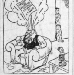
Under Hallens sol: + 34° i skuggan. Hjårdorna koka.

När de andra turisterna rullat bort, begräns vatten i närmsta stuga och stogo oss i språk med folket därinne. Jag visste att om vi kommit till Ingelstad för temti år sen, kunde vi ha råkat på pålitligt gammal folk som kunnat vittna att deras fäder vid högtider sett högen lyfta sig på fyra pelare av guld och konungar dansa med sina damer i strålende belysning därinne. Men dessa tider voro nu förbi, Inge med sin kungliga familj visade sig inte mer, endast en av sönerna i stugan hade en vyarskövill — fullt nykter, underströks det — sett högen stå i jusan låga.