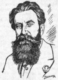
Professor Otto Schmidt.

Det kan inte beskrivas hur fångslande de är, dessa emne, enkelt uttryckande och ändå strålände människor, som med det anspråkslösa leende ta emot folkmassans stormande jubel. Professor Schmidt själv, skäggig och mager och vänlig, de olika medhjälpar-