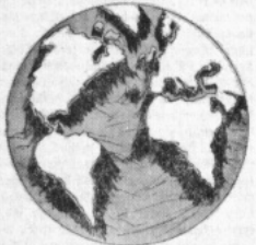
Om Atlanten bleve torrlagd.

Ja, så är det ofta, och vi svenskar äro kanske mer än andra känsliga för orik-