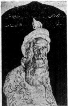
Firdausi. Efter en skulptur, utförd av hans samtida, bildhuggaren Molk.

Skolklassernas minskade omfång, som ju uppenbarligen med våra fallande födelsettsiffror måste komma till stånd, borde